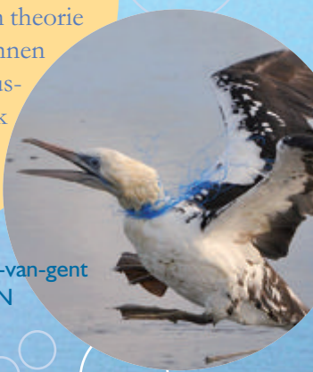
Gestrikte jan-van-gent

Het onderwaterlandschap voor de Belgische kust wordt gekenmerkt door talrijke, ondiep gelegen zandbanken. De toppen van sommige zandbanken liggen zó ondiep dat ze droog komen te liggen bij extreem laagtij. In theorie zou je er dus een wandelingetje kunnen maken. Deze zandbanken en de tussenliggende geulen zijn belangrijk voor de biodiversiteit en zijn door Europa bestempeld als te beschermen.